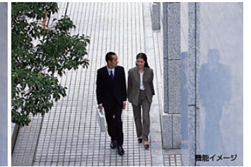
※画像はサンプルイメージです。